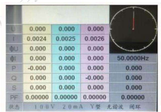
交流输出界面操作说明