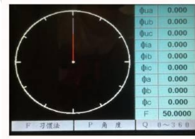
波形显示界面操作说明